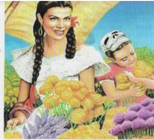
DÍA DE MUERTOS