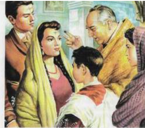
MIÉRCOLES DE CENIZA