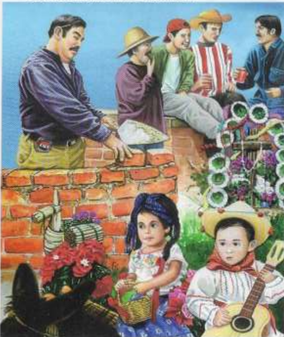
DÍA DE LA SANTA CRUZ