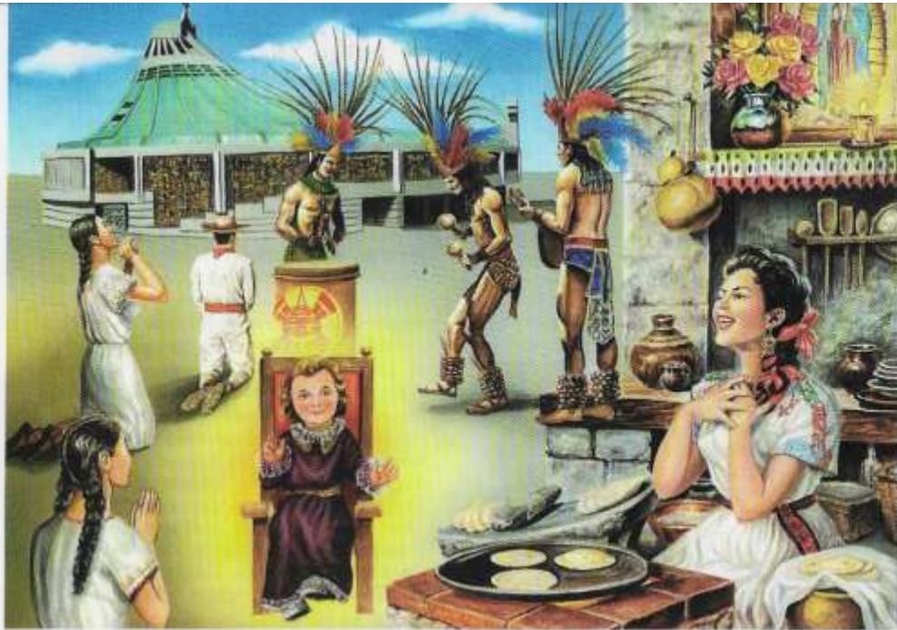
DÍA DE LA VIRGEN DE GUADALUPE